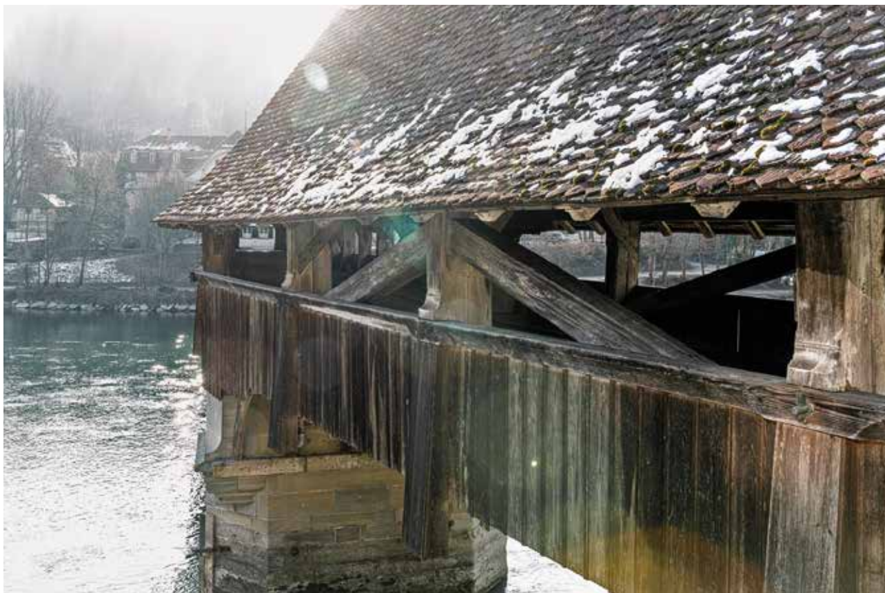
Neubücke im Winter.

Der Gemeinderat beantragt den Stimmberechtigten, das vorliegende Reglement über die Mehrwertabgabe zu beschliessen.